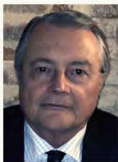
ANTONIO SALAS CARCELLER

Para dotar a la obra de un contenido práctico se incluyen esquemas, resolución directa de preguntas frecuentes, análisis jurisprudenciales y formularios de interés.