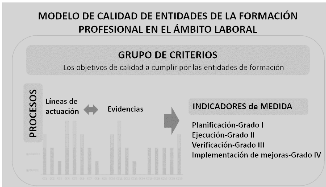
*Cuadro 2: Esquema Modelo de Calidad de Entidades de Formación en el ámbito Laboral CLM.

Grupos de Criterios de Calidad. Categorías en las que se clasifican los distintos criterios atendiendo a su contenido. En el modelo de calidad se establecen tres grandes grupos de clasificación de criterios de calidad y dos subgrupos dentro de uno de los principales: